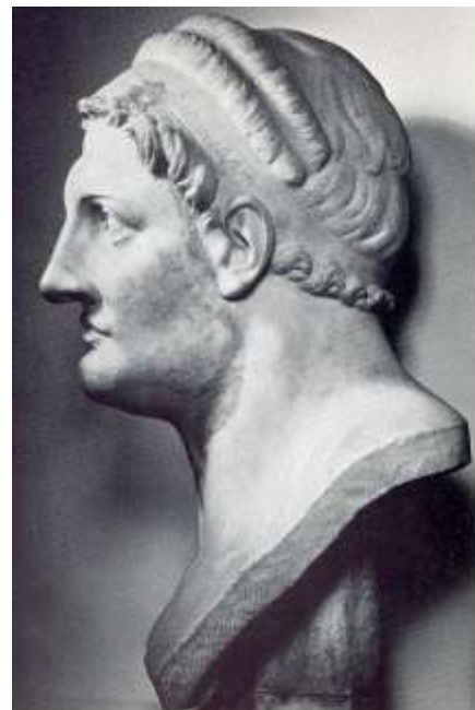
I. Ptolemaiosz. Márványfej, Louvre.

Már az Alexandrosz halotti ágya melletti osztozkodáskor megszerezte magának az egyiptomi szatrapia feletti rendelkezés jogát, és a helyszínre sietett. Kleomenészt visszaélései miatt hamarosan kivégeztette, és ekkortájt vette feleségül Eurüdikét, diadokhosztársa, Antipatrosz lányát. (Közös gyermekeik Keraunosz, Meleagrosz, még egy fiú, Lüsandra, Ptolemaiosz, és talán Theoxené.)