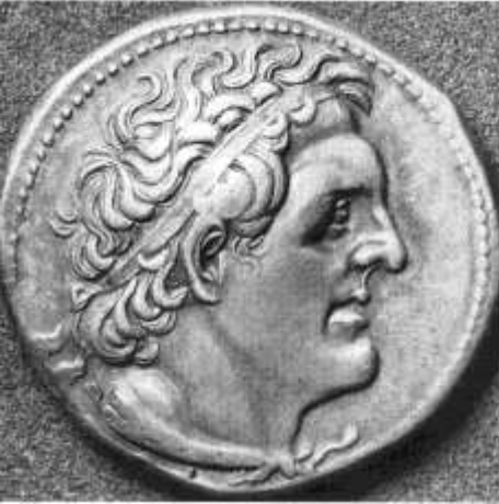
I. Ptolemaiosz feje egy tetradrachmán Kr.e. 295-290. (Catiglione László, Hel- lénisztikus művészet, Bp. 1996, 99. old. )

amelyet magántulajdonaként tisztviselői révén irányított, akik – a korábbi szokásoknak megfelelően – mindenkitől adót szedtek (ezek rendszere azonban átalakult – fejadó, földadó, forgalmi adó, illeték, vám stb. volt) a kincstár ( baszilikon ) számára. Ezt azonban részben terményekben, tehát természetben, részben pénzben tették – az egyes területek pénzbevételeiket 10 naponként a kijelölt bankba kellett befizessék. (A parasztok a túlzott adóktól az adóterületekről való elköltözéssel védekeztek.) A pénzkibocsátás, -váltás állami monopólium volt, éppúgy, mint a papiruszkészítés, olajtermelés, len- és kendertermesztés, sókitermelés, ill. ezek eladása vagy a gabonaexport. A kereskedelem elősegítésére új kikötőket épített, és rendben tartotta a szárazföldi és vízi utakat.